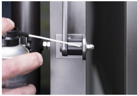
Schmieren der Umlenkrolle (Distanzhülsen)

Verwenden Sie nicht zu viel Spray, so können Sie ein Nachtropfen und damit unschöne Flecken am Boden vermeiden.