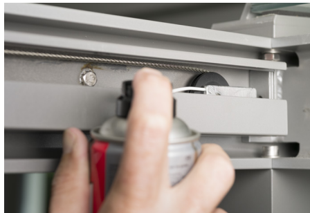
Schmieren der Umlenkrollen