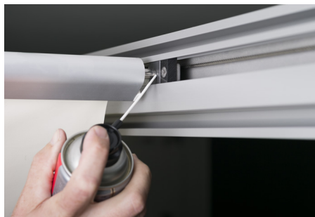
Schmieren der Mitnehmer und Führungsnut