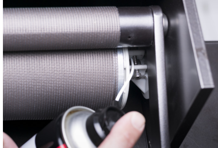
Schmieren des Walzenlagers