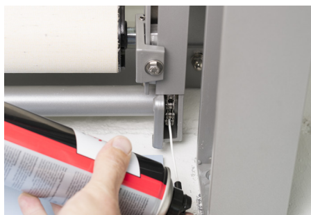
Schmieren der Zahnräder