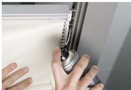
Schmieren aller Gleiterachsen